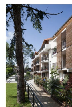
O SAINT JEAN